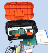
Набор-укладка для фотоколориметрирования Экотест-2020-К

Дополнительные модули к лабораториям НКВ-Р