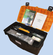
Набор для гидробиологических исследований