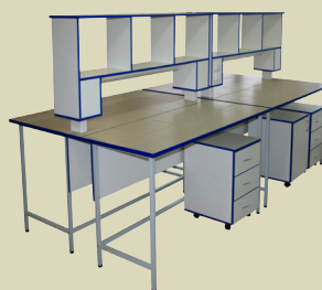
Стол лабораторный островной физический