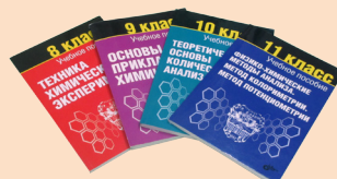
Комплект учебно-методических пособий для учащегося