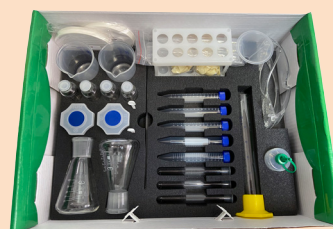
Набор учащегося для химико-экологического практикума в открытом виде