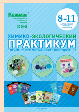
Химико-экологический практикум. Пособие для учителя