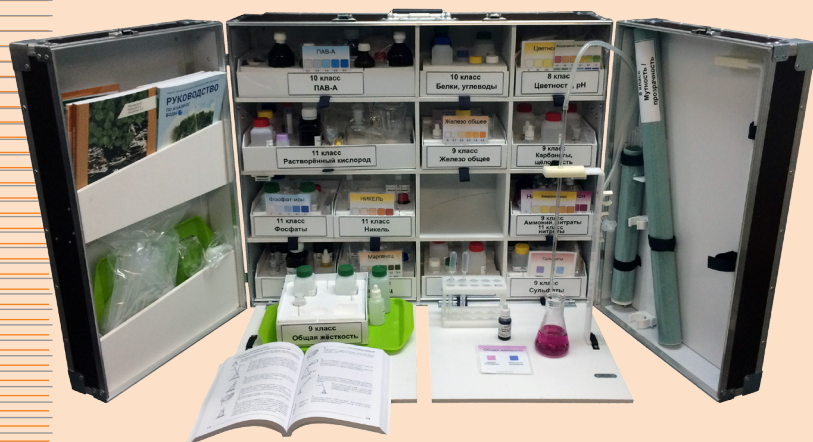
Укладка-лаборатория учителя ШХЭЛ в раскрытом развернутом виде

Является оригинальным учебно-методическим комплектом, разработанным специально для целей и задач химико-экологического практикума учащихся 8–11 классов под зарегистрированной товарной маркой «КРИСМАС» (свидетельства № 404860, № 570418).