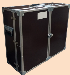
Укладка-лаборатория учителя ШХЭЛ в сложенном виде