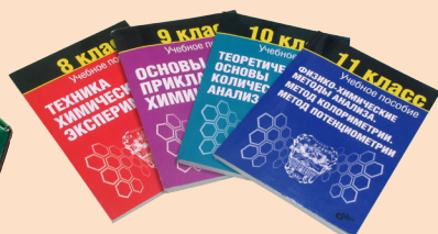
Комплект учебно-методических пособий для учащегося

Набор учащегося для химико-экологического практикума представляет собой простую укладку контейнерного типа с ложементом и содержит необходимые при практических работах принадлежности и посуду, а также учебные пособия для учащегося и сопроводительную документацию. Один набор учащегося рассчитан на одновременную работу 2-4 учащихся.