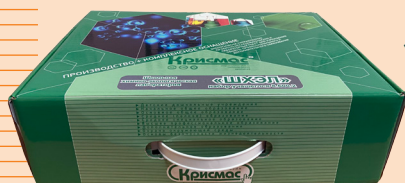
Набор учащегося для химико-экологического практикума

Укладка-лаборатория учителя дополняется модулями, предусмотренными в заказанной модификации (см. табл. 3). Средства дополнительной комплектации уложены отдельно от базовой укладки.