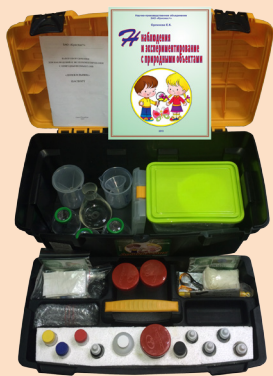
Набор в открытом виде