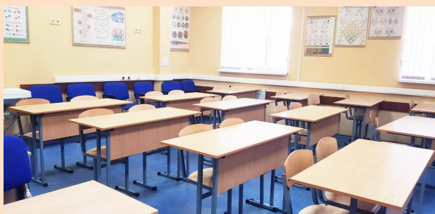
Вариант оснащения учебного кабинета

Выполняем как единичные, так и комплексные заказы «под ключ».