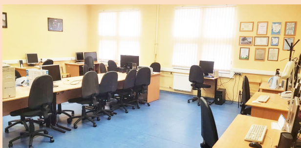
Вариант оснащения компьютерного класса