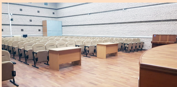
Вариант оснащения актового зала

Нашим существенным отличием от других компаний, работающих в этой области, является собственное производство широкого ассортимента специального и эксклюзивного учебного оборудования для экологически направленной учебно-исследовательской, проектной работы, а также экологического практикума в образовательных организациях всех уровней образования, начиная от дошкольного и заканчивая высшим профессиональным и дополнительным. Это оборудование широко и успешно используется в курсах химии, биологии, географии, естествознания, экологии, технологии (кулинария), ОБЖ, а также в различных спецкурсах.