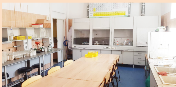
Вариант оснащения учебной лаборатории