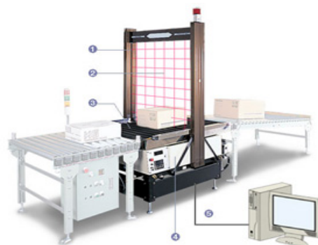
Измерители веса и габаритов

Срок отгрузки уточняйте у наших менеджеров Санкт-Петербург Отдел продаж: +7(812) 575-55-43 Факс: +7(812) 325-34-79 Email: lab@christmas-plus.ru