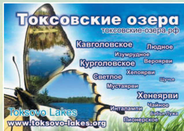
Проект «Токсовские озёра»

Помимо эколого-воспитательной работы с детьми и молодёжью региона, на базе Парка отдыха «Живое поле» в 2013 году состоится подведение итогов конкурса работ в области экологической журналистики «Экостиль» , а также будет создан питомник посадочного материала в рамках реализации не только эффективного, но и очень актуального проекта «Возродим дубравы богатырские» . Обсуждается вопрос о проведении на базе Парка отдыха «Живое поле» ежегодных областных фестивалей экологической песни . Успешный опыт такого рода акций есть.