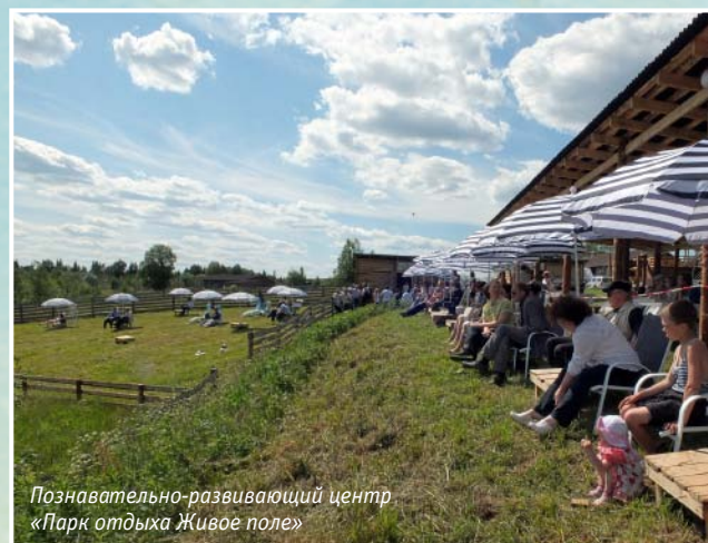
Познавательно-развивающий центр «Парк отдыха Живое поле»

Но ещё и до Указа В. Путина Ленинградская область стала инициатором ряда проектов, достойных заимствования в других регионах России.