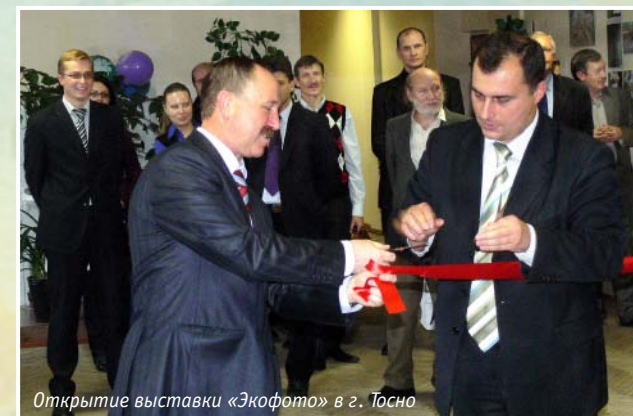
Открытие выставки «Экофото» в г. Тосно

Много лет успешно работает под руководством известного деятеля культуры, заслуженного артиста России Виктора Харитонова областной экологический театр.