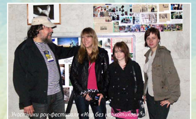
Участники рок-фестиваля «Мир без наркотиков» в СКК