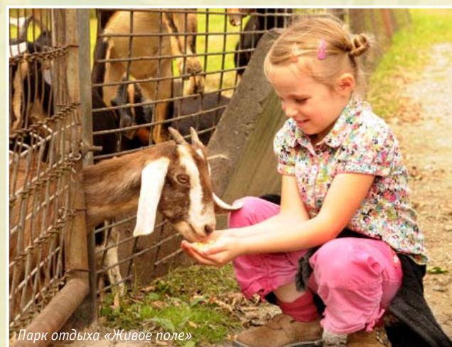
Парк отдыха «Живое поле»

Уже ряд лет под эгидой комитета по природным ресурсам в рамках эколого-патриотического воспитания детей и молодёжи проводятся детские экологические экспедиции и издаётся сборник «Труды школьников Ленинградской области по экологии и краеведению родного края».