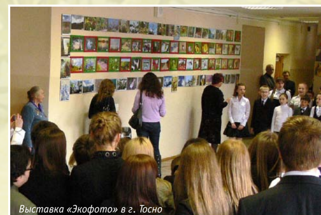
Выставка «Экофото» в г. Тосно

Проведено три областных ежегодных конкурса экологической фотографии детей и молодёжи «Экофото – образ жизни» . По итогам этого конкурса при поддержке местной администрации создана детская галерея экологической фотографии в школе №1 г. Тосно.